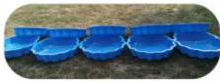
Bademuseln u. Sonnensegel TH Kondoros

Juli 2024: Für das TH Kondoros wurden 20 Bademuseln sowie 16 robuste Sonnensegel (3x3 Meter und 4x3 Meter) um die Zwinger zu beschatten, gekauft und direkt ans TH versendet. Die Sonnensegel sind ebenso als Regen/Schneeschutz geeignet. Für die Bademuseln u. Sonnensegel wurden 560,00 Euro ausgegeben.