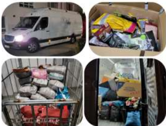
Übergabe von 600 Kg Sachspenden an das Tierheim der Lucy foundation

November 2024 = BALU wurde mit einer Kette an einer alten, stinkenden Matratze angekettet und ganz sicher hat er über einen langen Zeitraum nichts oder nur Müll zum Essen bekommen. Beim Auffinden war Balu mehr tot als lebendig und sein Körper völlig ausgemergelt. Viele Infusionen, Bluttransfusionen und Medikamente wurden verabreicht und täglich wurden Balus Blutwerte kontrolliert. Innerhalb von wenigen Wochen stabilisierte sich Balus Zustand und er entwickelte sich zu einem wunderschönen Hundejungen. Für Balu gingen insgesamt 718,76 Euro an Spenden ein und damit konnte seine komplette Klinikrechnung beglichen werden.