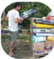
TH Kondoros: Wasserpumpe, Futterpalette Tierarzt Kätzchen